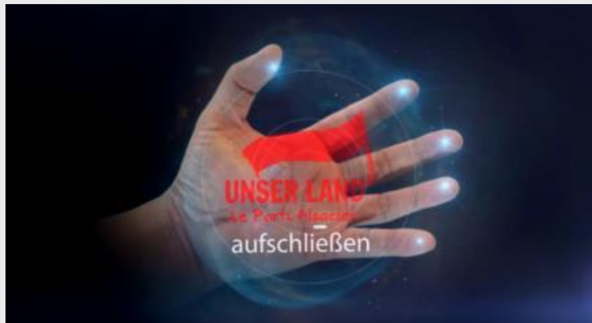
Clip de campagne d'Unser Land

Sur la #circo6709 Jean-Luc LEBER sera le candidat